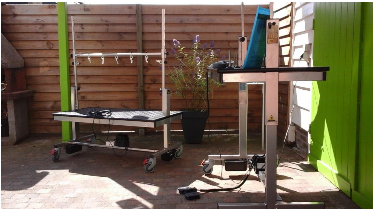
Abbildung: UDS Ergomatic Deluxe Trimmtisch mit Trimbügel